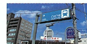
地下鉄名城線、上飯田線「平安通」駅