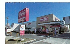
マックスバリュ若葉通店

●所在地/名古屋市北区石園町二丁目●交通/地下鉄名城線、上飯田線「平安通」駅徒歩5分●土地面積/公簿165.28㎡(約49.99坪)●土地権利/所有権●地目/宅地●用途地域/第一種住居地域●建ぺい率/60%●容積率/200%●その他の法令上の制限/準防火地域・31m高度地区・道路斜線制限・隣地斜線制限・日影制限・都市緑地法・景観法・都市再生特別措置法●現況/更地●引渡/相談●接道/南側幅員約7.3m公道●設備/都市ガス・公営水道・公共下水●備考/確定測量実施済・実測面積:164.38㎡(約49.72坪)●司法書士売主指定●取引態様/売主