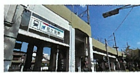
名鉄瀬戸線「尼ヶ坂」駅

●所在地/名古屋市東区白壁三丁目●交通/名鉄瀬戸線「清水」駅徒歩9分●土地面積/公簿108.38㎡(約32.78坪)●土地権利/所有権●地目/宅地●用途地域/商業地域●建ぺい率/80%●容積率/400%●その他の法令上の制限/防火地域・準防火地域・道路斜線制限・隣地斜線制限・都市緑地法・景観法・都市再生特別措置法●現況/更地●引渡/相談●接道/南側幅員約29.9m公道・西側幅員約10m公道●設備/都市ガス・公営水道・公共下水●備考/確定測量実施済・実測面積:108.43㎡(約32.80坪)●角敷地のため、隅切り部分(約3.0m)接道しています。●南側前面道路北側境界線から北側11mまでの部分「防火地域」、左記以外11mを超える部分「準防火地域」。建築物が複数の地域、区域にわたる場合、防火上の制限がもっとも厳しい地域の規制が適用されます。但し、制限の緩やかな地域に属する部分に防火壁を設ける場合は、その区画された防火壁外の部分には厳しい地域の規制は適用されません。(建築基準法第65条)●取引態様/売主