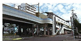
名鉄瀬戸線「清水」駅